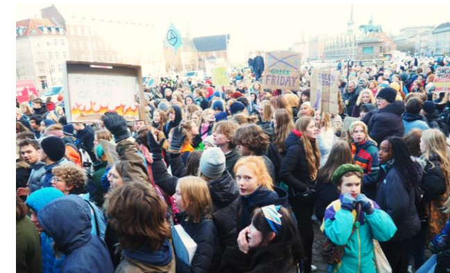
Green Friday, hvor 10.000 unge kritiserer det panikagtige forbrugsræs på Black Friday.

Vi gør holdt på rasteplasser og vi slutter dagene med stormøder i Roskilde, Albertslund og på Rådhuspladsen. Slut dig til nårsomhelst undervejs. Gå med et par timer, kom igen næste dag. Følg os hele vejen på Facebook.