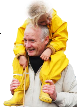
NB: Ingen aldersgrænse.

Husk: Sovepose, liggeunderlag, håndklæde, tandbørste.